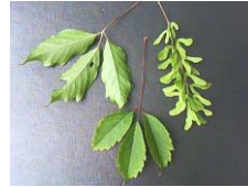
18 Acer cissifolium