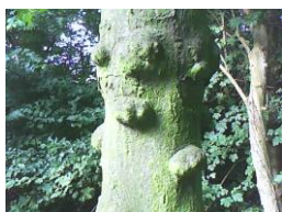
3 Gewone vuilboom

3 Gewone vuilboom (Sporkehout) - Frangula alnus - Europa, Middellandse Zee - grote knobbels.