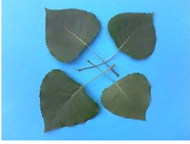
24 Canadese populier

24 Canadese populier - Populus x canadensis - (P. deltoides x P. nigra) - loopt vroeg uit, blad aan kortlot met vlakke tot iets ruitvormige bladvoet,