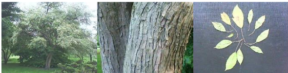
28 Malus (toringo)

27 (IJzerhout) - Parrotia persica - Iran - groeit conform de soort vooral in de breedte.