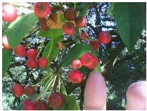
25 Malus toringo 'Rosea'

25 Appel - Malus toringo 'Rosea' - de soort: Japan - steunblaadjes , deels ingesneden, deel van de bladeren diep ingesneden of gelobd, bloemknop roze, bloem verbloeiend van roze naar wit, vrucht op 1-10-2015 purperrood . De soort zelf heeft geeloranje vruchten.