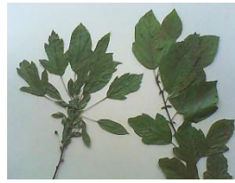
Links 28 Malus (toringo) - rechts 25 Malus toringo 'Rosea'

29 Appel - Malus - niet conform M. pumila (oude lijst), want dat is de oude naam voor 30, 31 en 32. Habitus stijf en opgaand, bloemknop roze, bloem verbloeiend naar wit, vrucht purperrood, blijvende kelk. Op 28-6-2016: bladsteel behaard, blad 2,5-10 cm. lang, gemiddeld 5-6 cm., boven vrijwel kaal, onder (nog) iets behaard, vooral langs de nerven. Habitus, wortelopslag, blad, formaat en kleur van de vruchten conform 33 en 39. Handboeken tegenstrijdig bij de in aanmerking komende soorten.